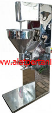
Dimensi: 450 x 1100 x 1300 mm