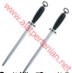
Bar Stainless Steel Bar : 25 cm