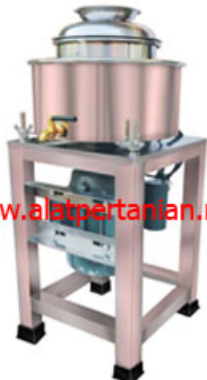
Dimensi: 450 x 1100 x 1300 mm